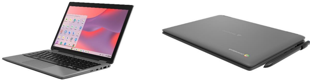
「mouse Chromebook U1-DAU01GY-A」